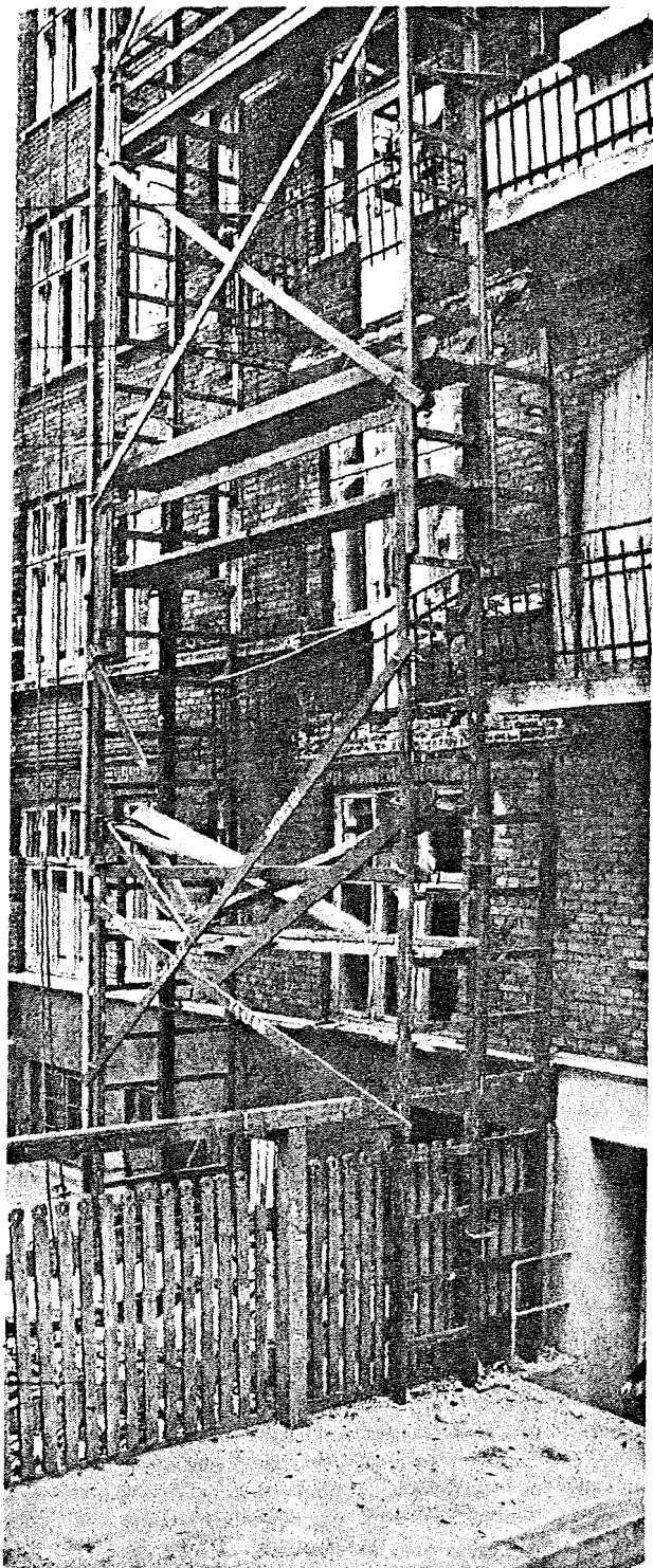
Arbejdsstedet, hvor altanen på 2. sal styrtede ned. Altanpladen har ikke været forsvarligt understøttet under arbejdets udførelse.